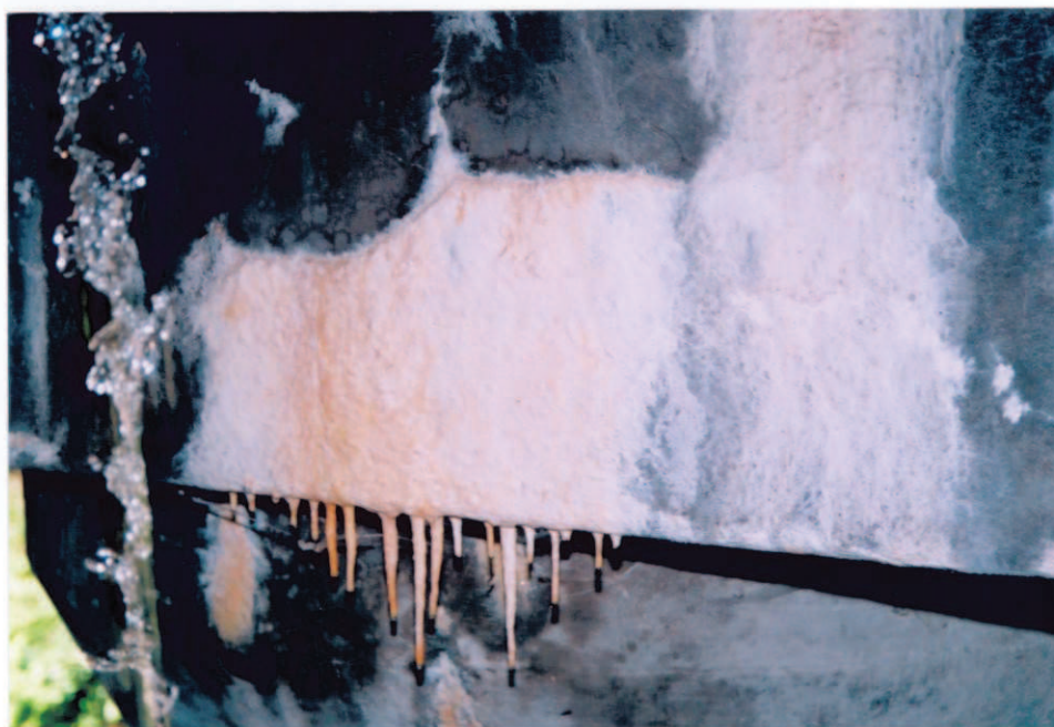
Obr.A15-32 Dolní hrana UP III. podpěry před jejím levým sloupem. Pohled proti vodě a k Červené Hoře,