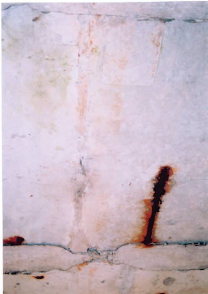
Obr.A15-19 Podhled 2. příčné spáry 4. nosníku 3. pole. Pohled po vodě a vzhůru, - v pravé polovině (na obr. dole) jsou drobné suché krápníky. Přes spáru zatékalo před pos- lední úspěšnou stavební údržbou, při které byla vyměněna vozovka, - prosvítání a koroze ob- nažené příčné výztuže.