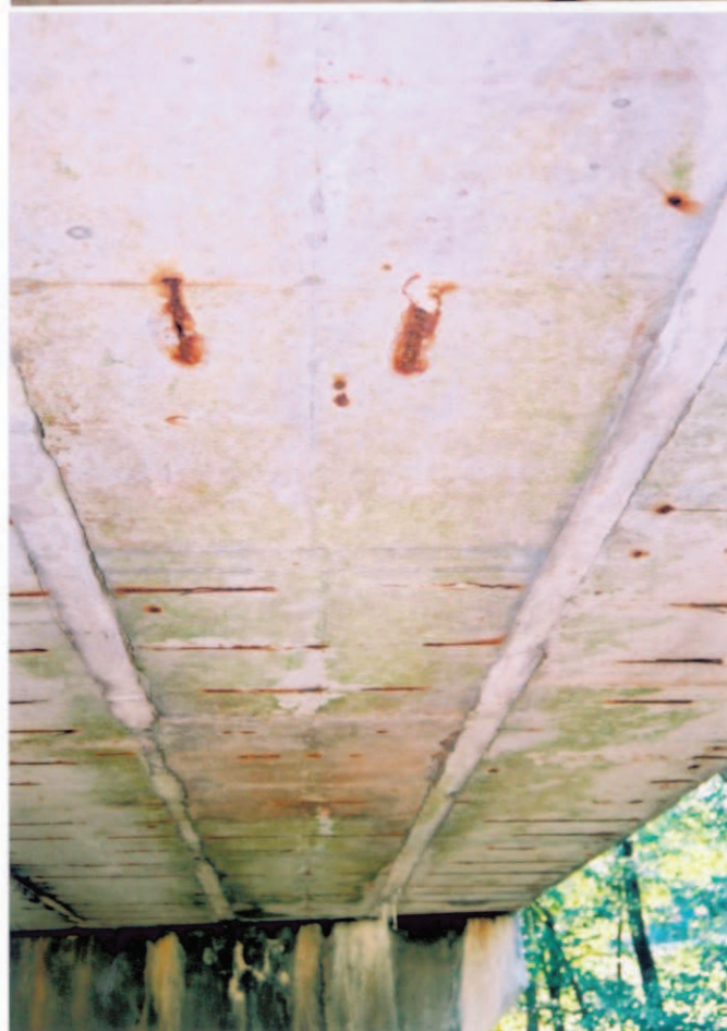
Obr.A15-20 Podhled 1. poloviny 2. nosníku 3. pole. Pohled proti směru staničení, ke Slatuně a vzhůru, - stopy po průsacích v ose nosníku bez trhliny nej- sou jednoznačně svědec- tvím o zatékání do kabe- lového kanálku, - prosvítání a koroze ob- nažené betonářské výztu- že.