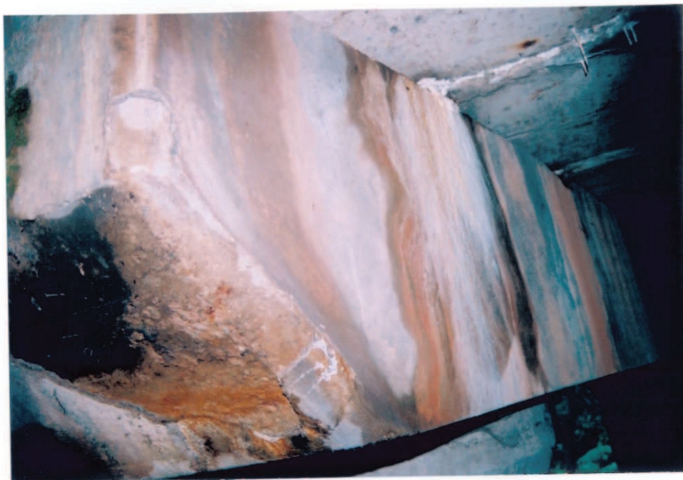
Obr.A17-06 Červenohorský líc úložného prahu IV. podpěry. Pohled zprava diagonálně ke Slatině a proti vodě, - na líc i čelo úložného prahu (UP), za jeho omítku a do spár mezi nosníky silně zatéká. Rozsáhlé i korozivně zabarvené inkrustace, - silná omítka UP je díky zatékání poškozena trhlinami.