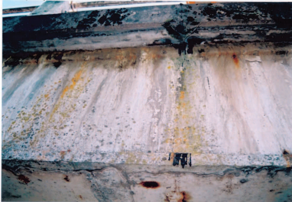
Obr.A15-24 Návodní fasáda NK ve třetině 3. pole. Pohled po vodě a vzhůru,