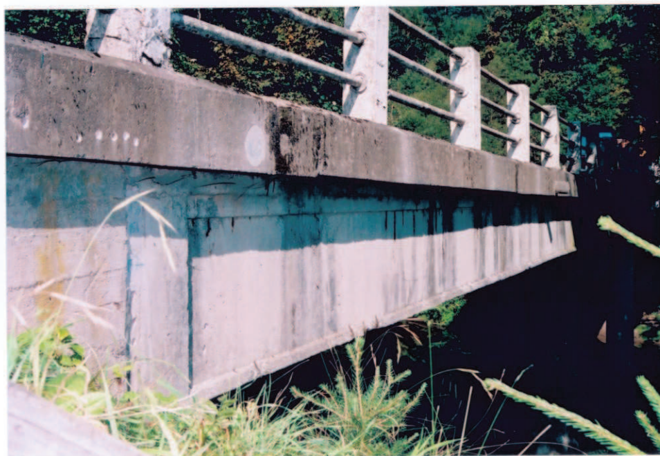
Obr.A17-32 Pravá, povodní fasáda. Pohled od I. podpěry ve směru staničení, k Červené Hoře,