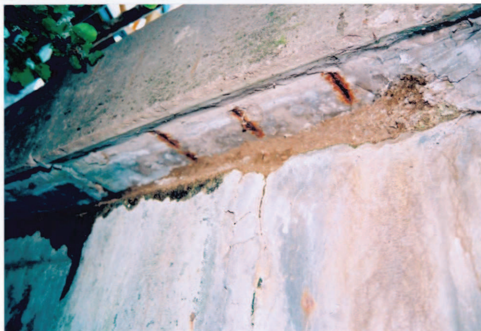
Obr. A16-29 Povodní fasáda NK nad UP II. podpěry. Pohled diagonálně ke Slatině, proti vodě a vzhůru,