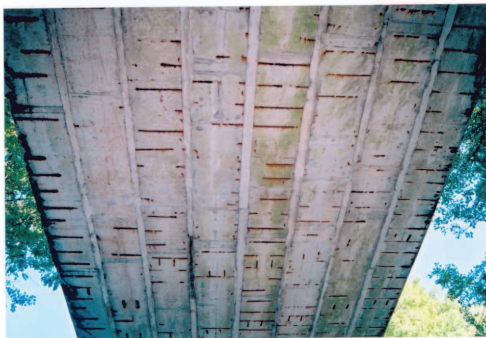
Obr.A17-24 Podhled 2. třetiny 2. pole. Pohled přímo vzhůru, - až na horní část II. podpěry, viz obr. A17-23, - 3. třetina podhledu 2. pole je zachycena spolu se slatin-skou stranou III. podpěry na obr. A17-14 v odst. MEZILEHLÉ PODPĚRY CELKOVĚ.