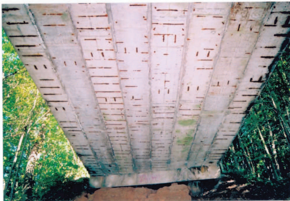
Obr.A17-30 Podhled 2. poloviny 4. pole. Pohled ve směru staničení, k Červené Hoře a vzhůru,