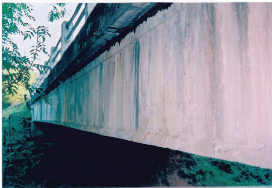
Obr.A16-30 Povodní fasáda NK v 1. poli. Pohled přibližně proti směru staničení, ke Slatině,