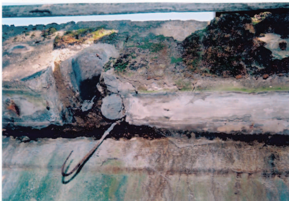
Obr.A16-02 Návodní fasáda, polovina rozpětí 2. pole. Pohled diagonálně po vodě a vzhůru,