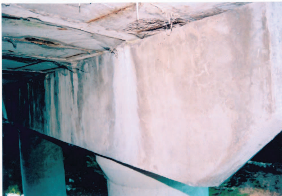
Obr.A16-35 Slatinský líc úložného prahu III. podpěry. Pohled zprava diagonálně proti vodě a k Červ. Hoře, - na úložný práh (UP), do spár mezi nosníky a do trhlin v 8. nosníku zatéká. Inkrustace i ve formě krápníků, - omítka UP je díky zatékání poškozena trhlinami, - odvodňovací otvory nosníků při UP III. podpěry vykazují výtoky.