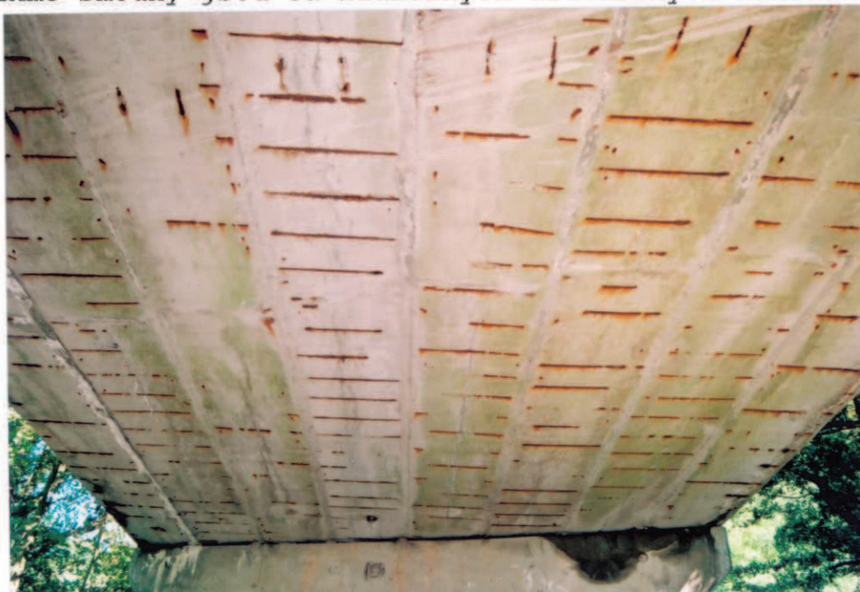
Obr.A17-26 Podhled 2. poloviny 1. pole. Pohled ve směru staničení, k Červené Hoře a vzhůru,