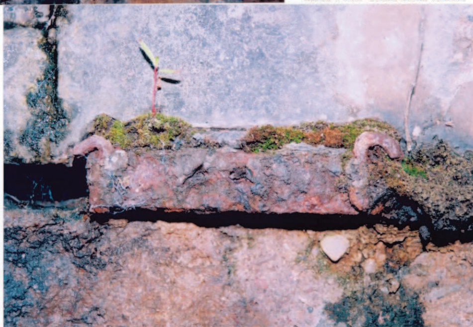
Obr. A15-12 Detail kluzného ložiska pod 1. nosníkem 4. pole nad UP IV. podpěrou. Pohled po vodě,