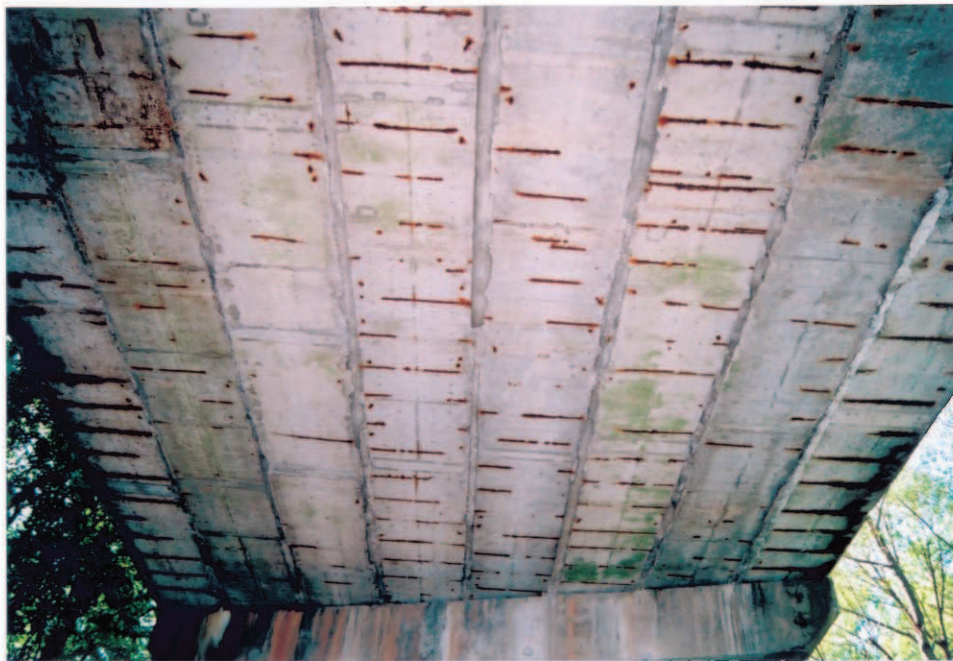
Obr.A17-29 Podhled 1. poloviny 4. pole. Pohled proti směru staničení, ke Slatině a vzhůru,