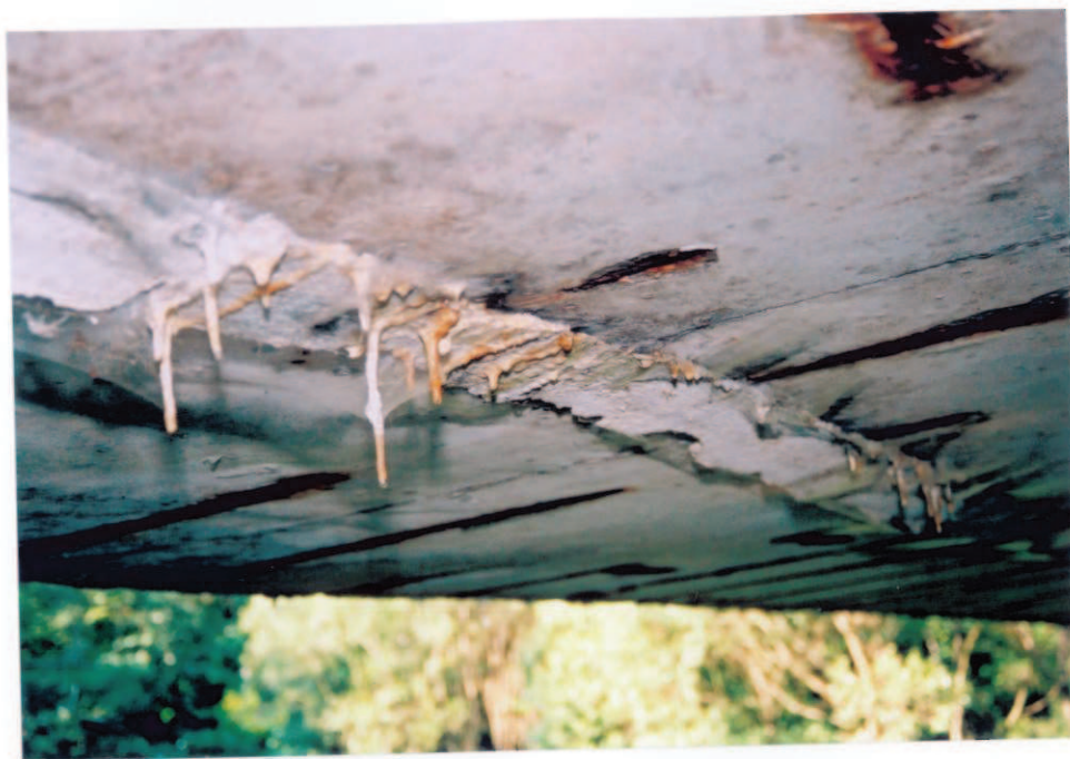
Obr.A16-06 Podhled podélné spáry mezi 1. a 2. nosníkem přibližně v polovině rozpětí 2. pole. Pohled proti vodě a ve směru staničení, k Červené Hoře,