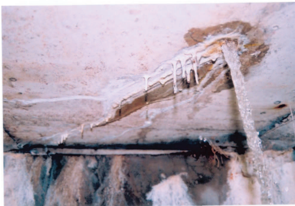
Obr.A15-31 Podhled 2. nosníku těsně před III. podpěrrou. Pohled přibližně k Červené Hoře,