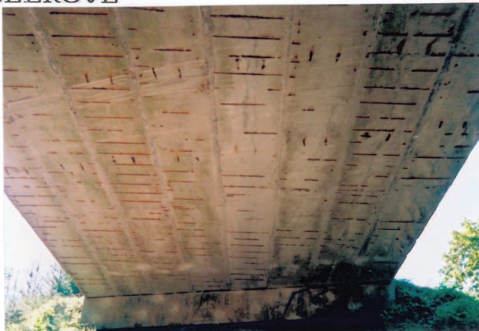
Obr.A17-25 Podhled 1. poloviny 1. pole. Pohled proti směru staničení, ke Slatině a vzhůru,