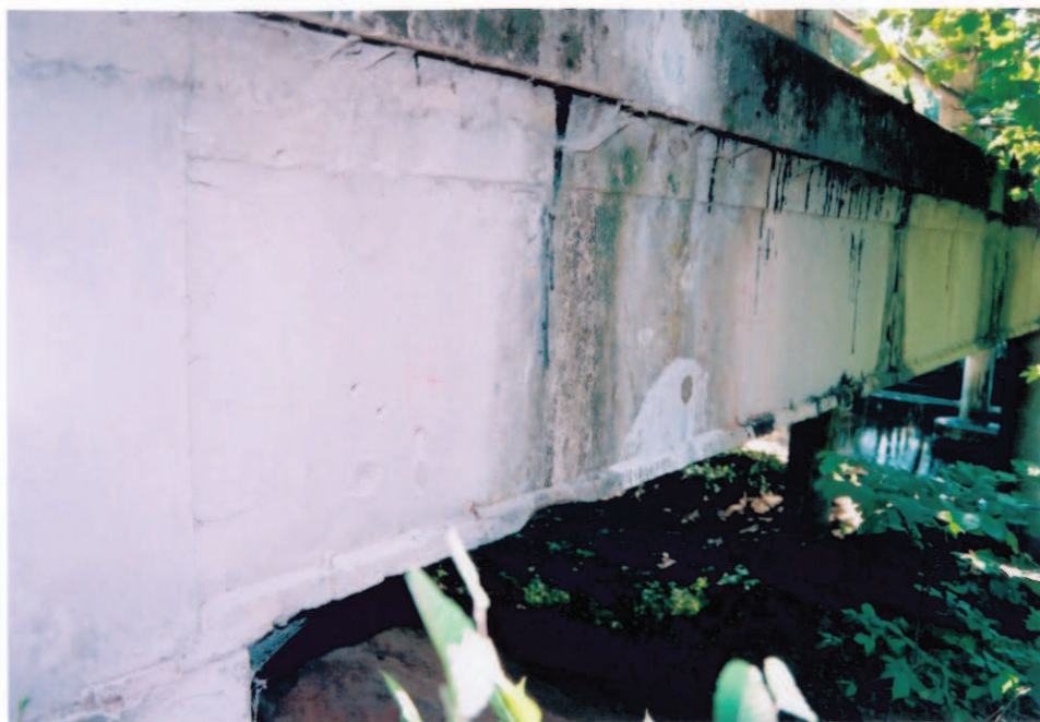
Obr.A17-33 Levá, návodní fasáda. Pohled od V. podpěry proti směru staničení, ke Slatině, - na fasádu krajního nosníku zatéká nepravidelně zpod říms, pravidelně pod netěsnými spárami mezi římsovkami. Příčná výztuž místy hojně prosvítá a koroduje, - zpod říms vyvěrají praménky měkkého asfaltu, - římsy v nevětrané části mostu zarůstají mechem.