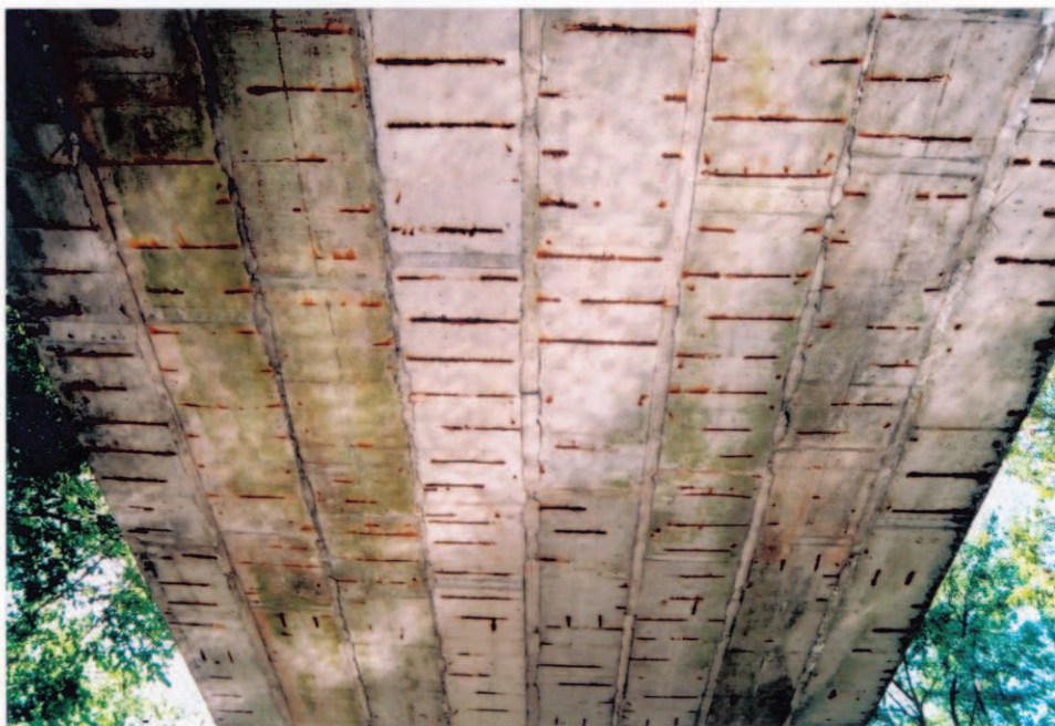
Obr.A17-27 Podhled 2. třetiny 3. pole. Pohled proti směru staničení, ke Slatině a vzhůru,