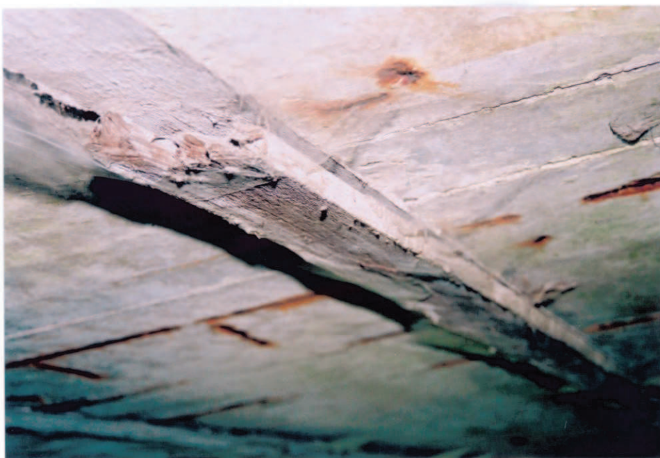
Obr.A16-07 Podhled podélné spáry mezi 3. a 4. nosníkem přibližně v polovině rozpětí 2. pole. Pohled proti vodě a ve směru staničení, k Červené Hoře,