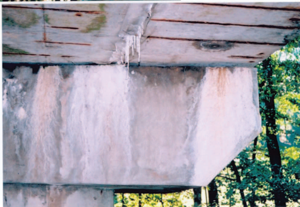
Obr.A15-22 Podhled podélné spáry mezi 1. a 2. nosníkem a konec UP III. podpěry. Pohled z třetiny 3. pole proti směru staničení, ke Slatině a vzhůru,