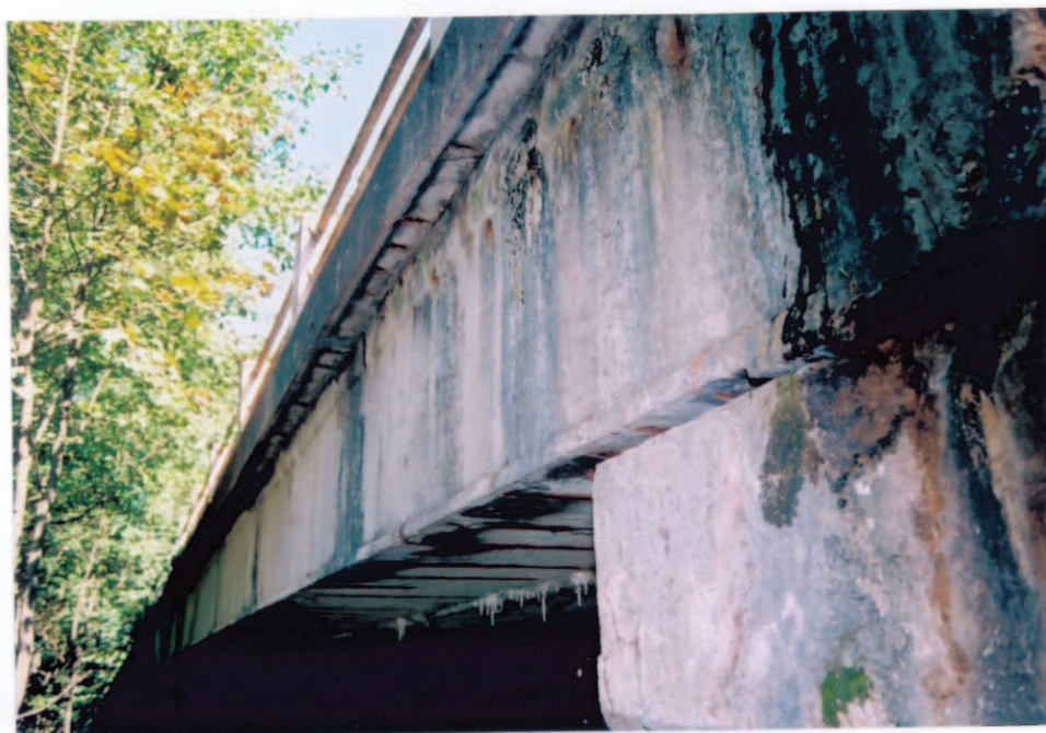
Obr.A15-14 Návodní fasáda NK ve 4. poli. Pohled přibližně ve směru staničení, k Červené Hoře,