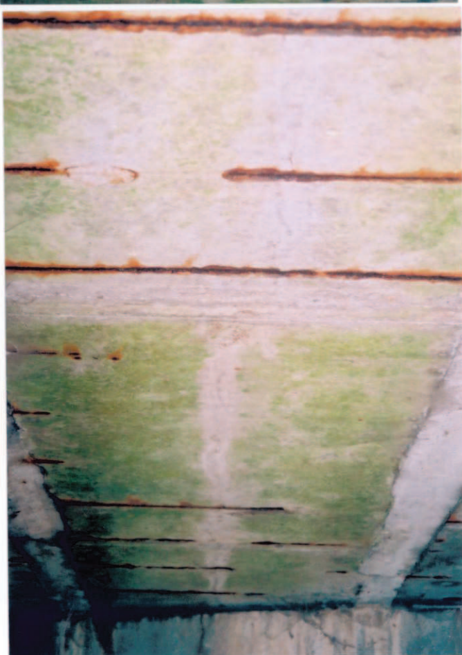
Obr.A16-09 Podhled 5. nosníku v 1. polovině 2. pole. Pohled proti směru staničení ke Slatině a vzhůru, - trhлина v ose nosníku téměř bez inkrustací, - prosvítání a koroze obnažené příčné výztuže.