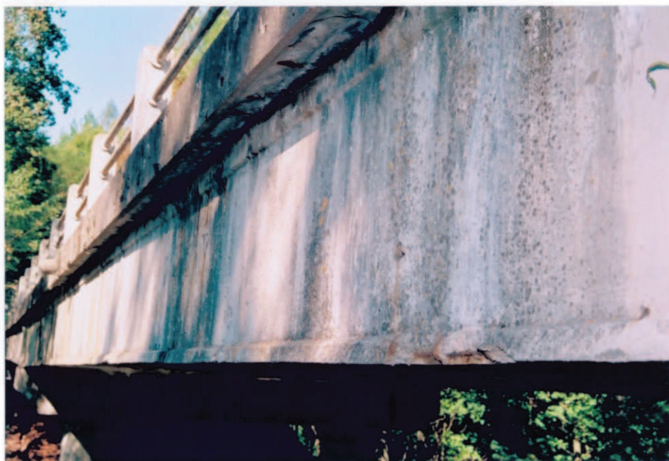
Obr.A16-03 Návodní fasáda NK ve 3. poli. Pohled přibližně ve směru staničení, k Červené Hoře,