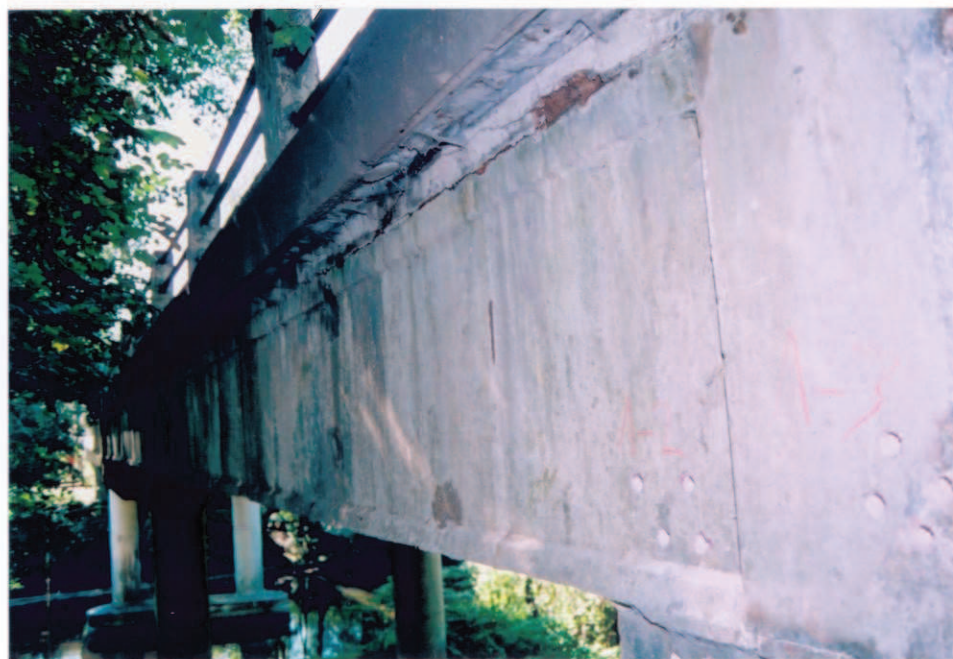
Obr.A17-34 Pravá, povodní fasáda. Pohled od V. podpěry proti směru staničení, ke Slatině, - až na vyvěrání praménků asfaltu zpod říms, viz obr. A17-33.