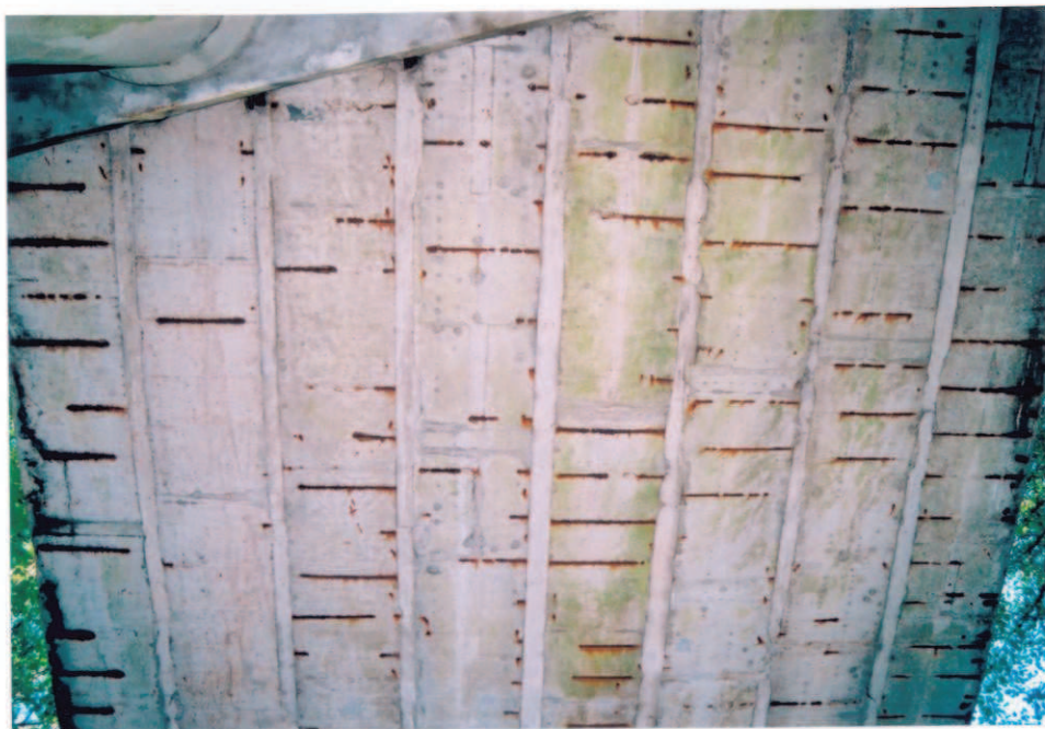
Obr.A17-23 Podhled 1. třetiny 2. pole. Pohled přímo vzhůru, - zcela nahoře je horní část II. podpěry, - místní stopy po zatékání do kabelových kanálků, - na pátém a částečně i následujících nosnících jsou slabě uchycené mikroorganismy, což souvisí se zdržováním vody v dutinách a o promáčení betonu, - hojné obnažení a koroze příčné betonářské výztuže. Krátké korodované ocelové vložky jsou dolní části montážních závěsů středních částí nosníků.