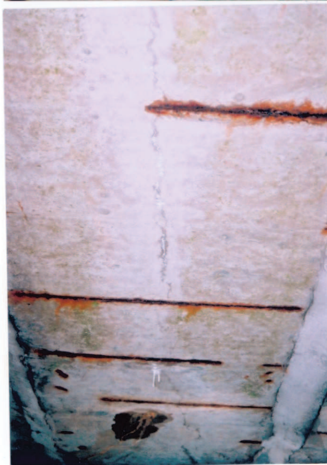
2. pole zleva