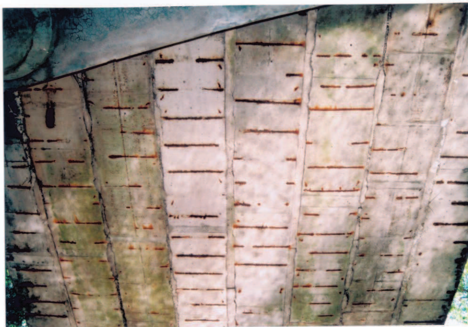
Obr.A17-28 Podhled 3. třetiny 3. pole. Pohled proti směru staničení, ke Slatině a vzhůru,