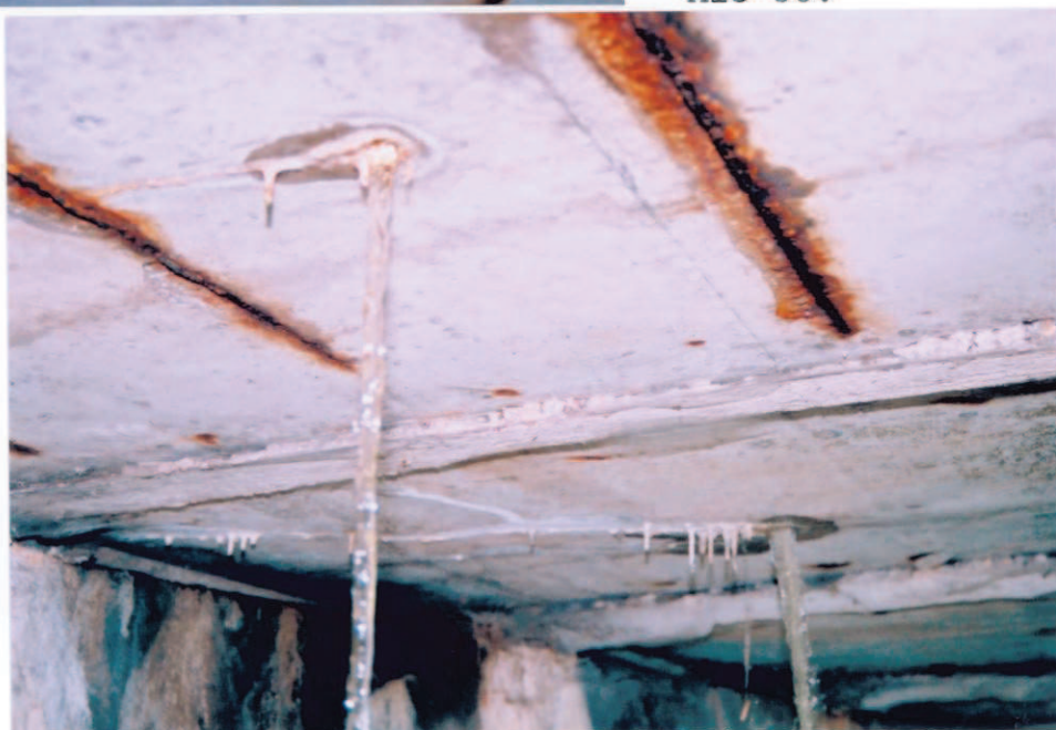
Obr.A15-30 Podhledy 1. (nahore) a 2. (za ním) nosníku těsně před III. podpěrou. Pohled k Červené Hoře a po vodě,