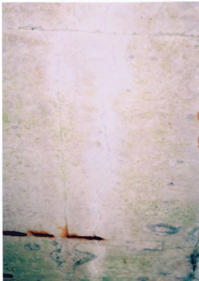
Obr.A16-08 Podhled 4. nosníku v 1. polovině 2. pole. Pohled proti směru staničení ke Slatině a vzhůru, - trhлина nalevo od osy nosníku (na obr. vpravo) s drobnými inkrustacemi, - místy prosvítá a koroduje obnažená příčná výztuž.