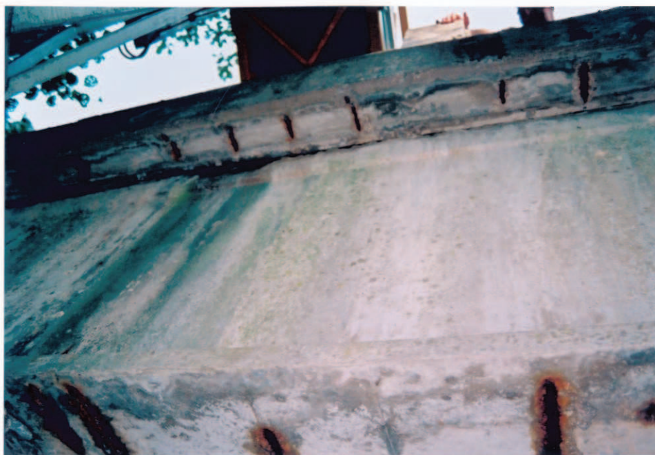
Obr.A16-11 Návodní fasáda NK ve třetině 2. pole. Pohled po vodě a vzhůru,