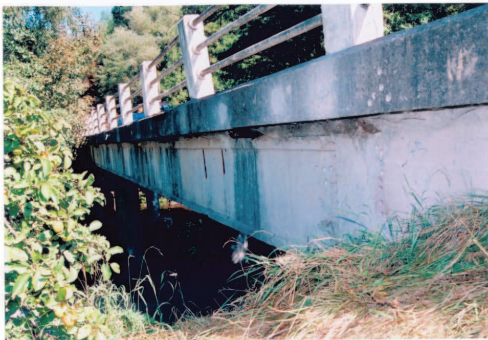
Obr.A17-31 Levá, návodní fasáda. Pohled od I. podpěry ve směru staničení, k Červené Hoře,